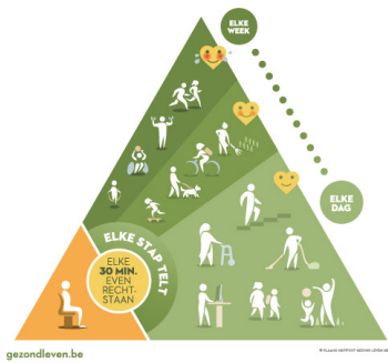
BEWEGINGSDRIEHOEK VERBODEN RECHTSTREEKS GEZOND LEVEN

In deze fase zijn de meeste patiënten goed gerecupereerd. Dagelijkse lichaamsbeweging moet op het programma staan met voldoende aandacht voor een gezond eet- en leefpatroon.